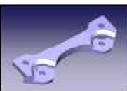
①設計・モデリング

最大128台迄の同時通信機能(DNC) 機械設備運転状況収集 リモート通信モード (NCより遠隔操作可能) スケジュール運転機能 サブプロ展開・送信機能 ファイル管理機能 (データ内検索・工具検索) 図面&見積等イメージデータ連携機能 NCデータ描画・編集機能・切削シミュレーション Eメール自動配信 (DNC運転設備状況監視)