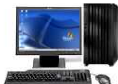
ファイルサーバー セキュリティ管理 ドメイン管理