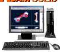
2.5次元CAD/CAM マシニング加工プログラム作成