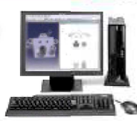
2~3次元CAD/CAM マシニング・ワイヤ加工プログラム作成