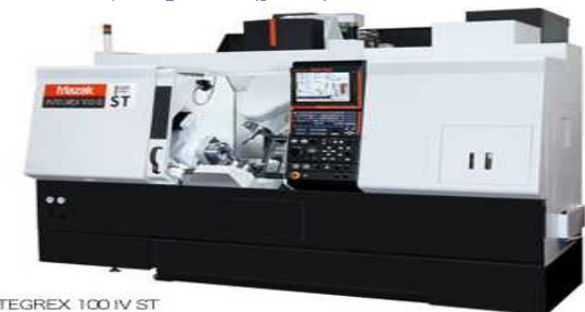
INTEGREX 100 IV ST