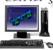
3次元CAD 設計 構造・振動・強度解析